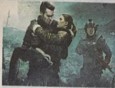
▲ A casa The blackout, solo in streaming

Un evento non stop di 72 ore fra fantasy, fantascienza, horror, thriller, action: in altre parole una cavalcata nel cinema di genere per raccontare gli eroi per una volta umani. È ciò che propone "Heròes International Film Fest", una nuova rassegna in programma dal 6 all'8 novembre. L'appuntamento, inizialmente previsto alla Casa del Cinema, è stato dirottato online e si svolgerà sulla piattaforma MYMOVIES. Il cartellone propone una sezione di lungometraggi in anteprima nazionale; un concorso di corti; varie masterclass e workshop con professionisti italiani e stranieri; un documentario che illustra il lavoro dei principali studios specializzati in effetti speciali; un cineconcerto con gli ottoni dell'Orchestra Italiana del Cinema che suoneranno i più celebri brani di John Williams. franco montini