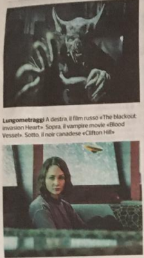
Lungometraggi A destra: il film rosso «The Blackout» di Justin Dix. Sotto: il vampiro movie «Blood Vessel» di Albert Shin