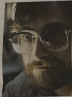
Il film "Escape from Pretoria"

IN EVIDENZA "ESCAPE FROM PRETORIA" CON DANIEL RADCLIFFE NEI PANNI DI UN CITTADINO SOTTO ACCUSA PER ATTI DI TERRORISMO