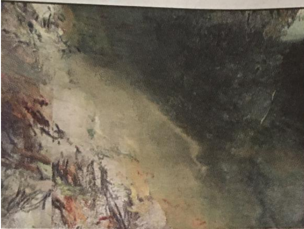
a serie Micro e Macro alla Gnam