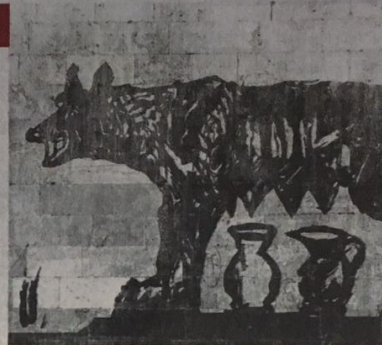
La lupa di William Kentridge immagine simbolo della rassegna "Luce sull'archeologia"

Superman ma anche Harry Potter e Il Gladiatore . Punta i riflettori sulle varie rappresentazioni dell'eroe, tra forza, magia e superpoteri, il concerto degli ottoni dell'Orchestra Italiana del Cinema che, alle 10.30, dalla sala A degli studi di registrazione Forum Music Village sarà trasmesso in diretta streaming su MyMovies, nell'ambito di Heroes In-